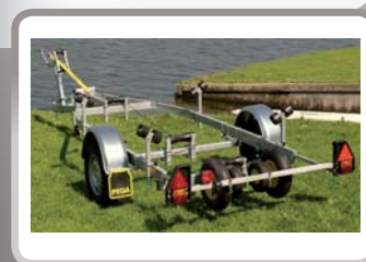
Pega trailer SH600/500