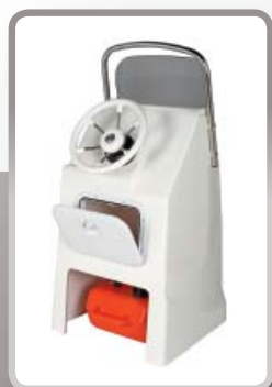
Stuurconsole Optima 800